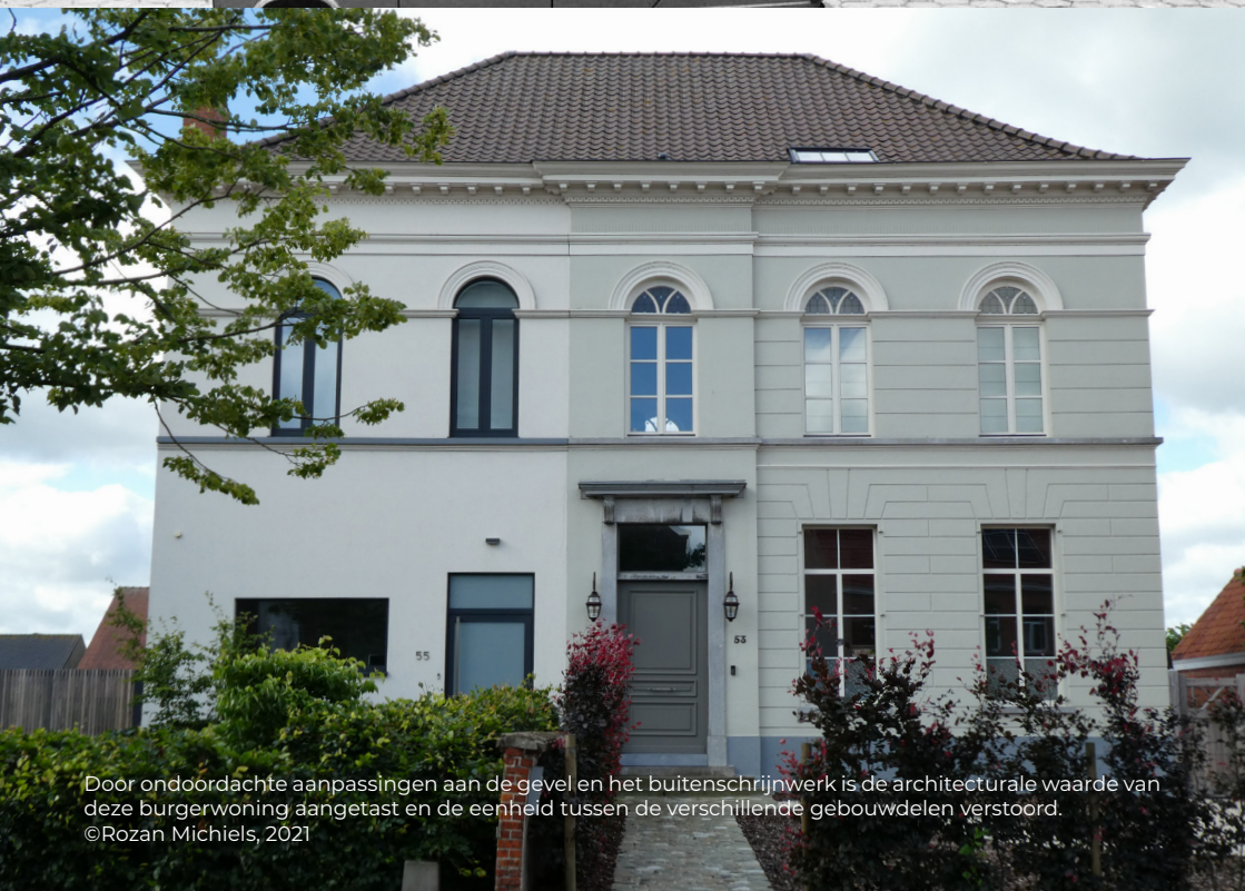
Door ondoordachte aanpassingen aan de gevel en het buitenschrijnwerk is de architecturale waarde van deze burgerwoning aangetast en de eenheid tussen de verschillende gebouwdelen verstoord.